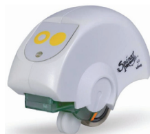
Obr. 4 Spinální myš (Spinální myš, 2014)